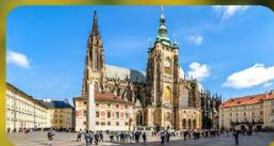
เข้าชม 2 ปราสาท ปราก และเซ็นบรุนน์