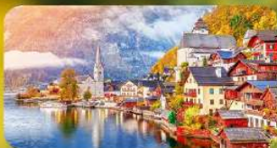
การ์นต์ฟัก Hallstatt / St. Wolfgang หรือริมทะเลสาบ 1 คืน