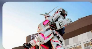
ซัปโปะไอโดะ