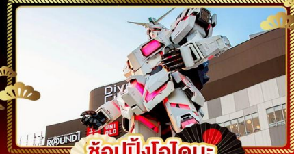
ช็อบบิงโอไดบะ