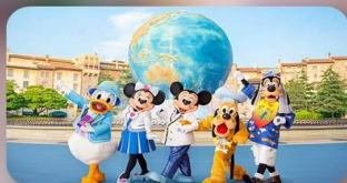
อิสระตามอริยาซึ 2 วัน