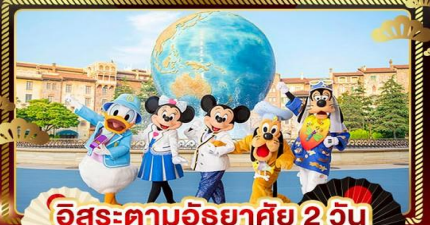
อิสระตามอริยาศัย 2 วัน