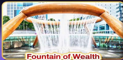
Fountain of Wealth