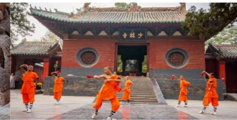
ชมโชว์กังฟูเล้าหลิน

*ทางบริษัทฯ ขอสงวนสิทธิ์ในการสลับโปรแกรมทัวร์ตามความเหมาะสมขึ้นอยู่กับสถานการณ์หน้างาน โดยคำนึงถึงผลประโยชน์ของลูกค้าเป็นสำคัญ