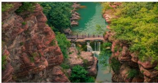
อุทยานสวรรค์หยุนโถซาน