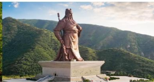
บ้านเกิดท่านกวนอู