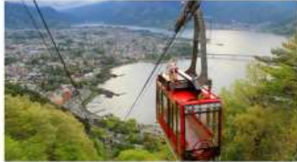
กระเช้าคางิคาจิ