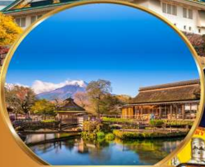
หมู่บ้านโอชิโนะฮาคิไค