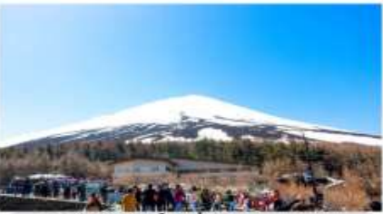
ภูเขาไฟฟูจิชั้นที่ 5