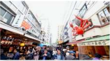
ตลาดปลาสึกิจิ