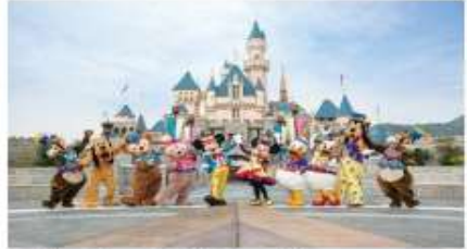
โตเกียวดิสนีย์แลนด์