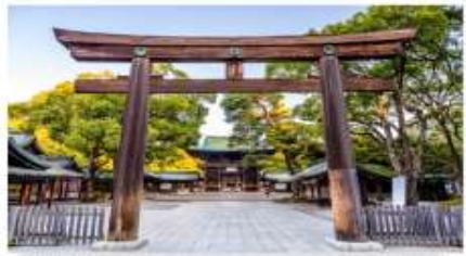
ศาลเจ้าเมจิ