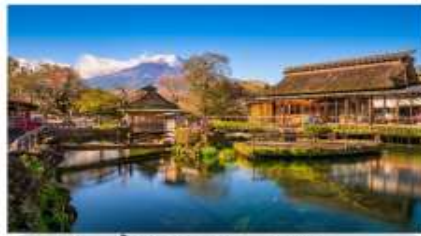
หมู่บ้านน้ำใส โอชิโนะ อักโก