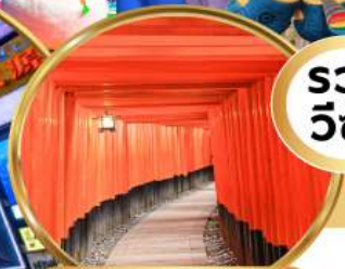
ศาลเทพเจ้าอินาริ