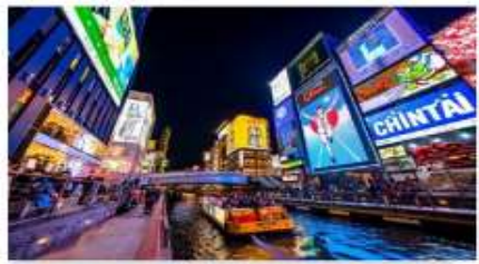
โตเกียวโมริ