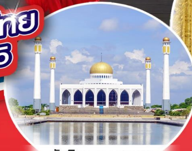
มัสยิดกลาง สงขลา