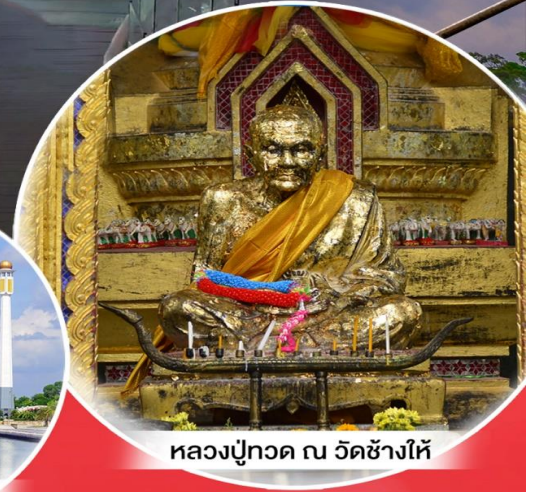
หลวงปู่ทวด ณ วัดช้างให้