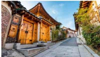
หมู่บ้านโบราณบุกชอน