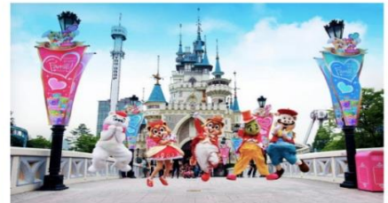
ลีดเต้เวิลด์