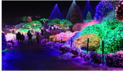
ชมเทศกาลประดับไฟฤดูหนาว