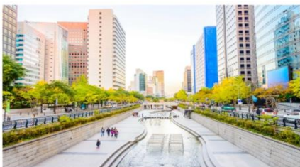
คลองชองเกซอน