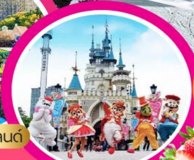
ลือตเตเวิ้ลด์