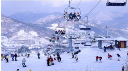
กิจกรรมลานสกี