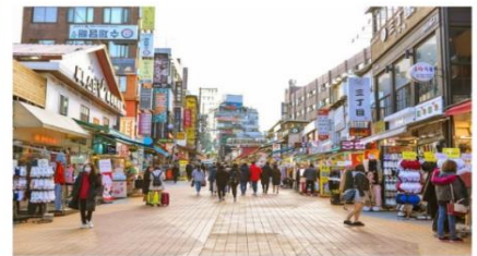
ย่านฮงแด