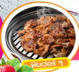
พินเวอร์ ๑