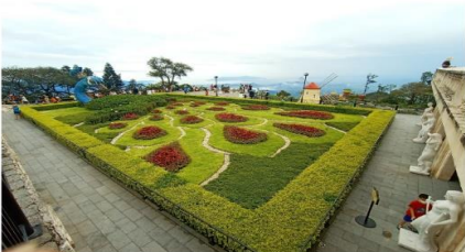
สวนดอกไม้แห่งความรัก