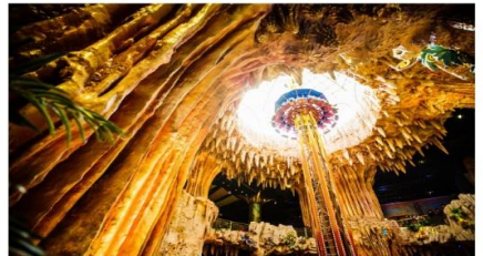
สวนสนุกแฟนตาซีพาร์ค