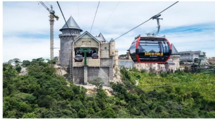
ขึ้นกระเช้าลอยฟ้า