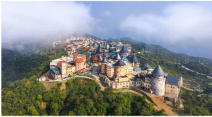
หมู่บ้านฝรั่งเศส