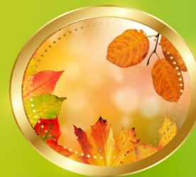
AUTUMN กันยายน-พฤศจิกายน