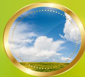
SPRING มีนาคม-พฤษภาคม