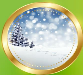
WINTER ธันวาคม-กุมภาพันธ์