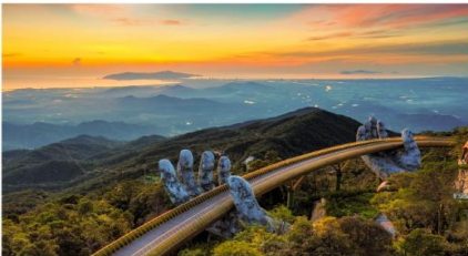
สะพานลอยฟ้า Golden Bridge