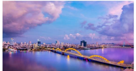
ชมสะพานมังกร