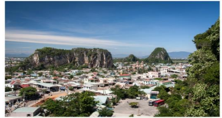
หมู่บ้านเกาะสลักหินอ่อน