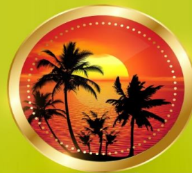
SUMMER มิถุนายน-สิงหาคม