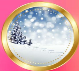
WINTER ธันวาคม-กุมภาพันธ์