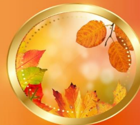
AUTUMN กันยายน-พฤศจิกายน