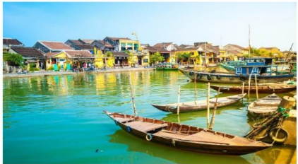
ฮอยอัน เมืองมรดกโลก