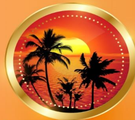
SUMMER มิถุนายน-สิงหาคม