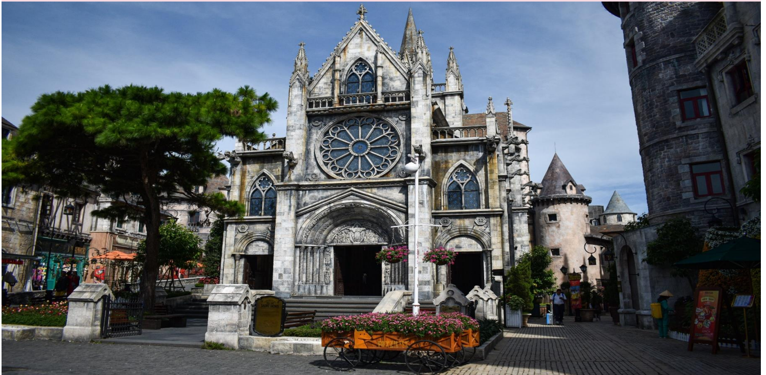
โบสถ์ เซนต์เดนิส โบสถ์คาทอลิกที่หมู่บ้านฝรั่งเศสบนบานาฮิลล์, เวียดนาม

สวนสนุกแฟนตาซีพาร์ค สวนสนุกในร่มและกลางแจ้งขนาดใหญ่มีหลายโซนให้ร่วมสนุกไม่ว่าจะเป็น จูราสติก พาร์ค (Jurassic Park) ท่องโลก ล้านปี , เอาท์รัน (Outrun) สนุกสุดเหวี่ยงกับเกมขับรถราวกับอยู่สนามแข่ง, อันเดอร์กราวด์ ทริป (Underground Trip) ผจญภัยแทนโลกกับความ มืดใต้ดิน , สไปเดอร์แมน (Spider Man) ใต้หน้าผาสูง 21 เมตร , ภาพยนตร์ในระบบ 3D,4D,5D , บ้านผีสิง