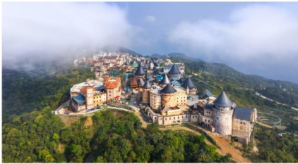
หมู่บ้านฝรั่งเศส