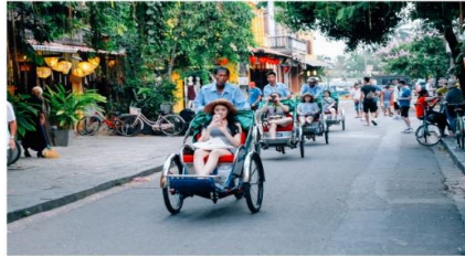
นั่งสามล้อชมเมืองฮอยอัน