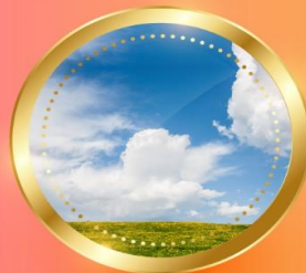
SPRING มีนาคม-พฤษภาคม