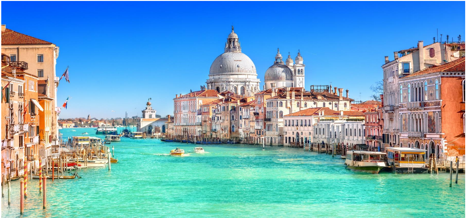
และมีชื่อเสียงโด่งดังไปทั่วโลกชมความงามสุดแสนโรแมนติกของเกาะเวนิส (มีค่าใช้จ่ายเพิ่มเติม)**

นำท่านเดินทางสู่ ท่าเรือตรอนเกตโต(Tronchetto) เพื่อโดยสารเรือสู่ เกาะเวนิส(Venice Island) เมืองในฝันของนักท่องเที่ยวหลายคน ชมความสวยงามของ จัตุรัสซานมาร์โก(Piazza San Marco) จุดศูนย์กลางของเกาะเวนิส ที่รายล้อมด้วยสถานที่สำคัญหลายแห่ง อาทิ มหาวิหารซานมาร์โก(St. Mark's Basilica) เดิมที่เป็นโบสถ์ส่วนตัวของผู้ครองเมืองในสมัยนั้น พระราชวังดอจส์ (Doge's Palace) ภายในของพระราชวังซึ่งประกอบด้วยห้องที่ประทับ เว็อนรับรอง ห้องทรงงาน ห้องดนตรี ห้องศิลปะ และห้องพิจารณาคดีซึ่งจะมี สะพานทอดถอนใจ(Bridge of Sighs) ที่เชื่อมต่อกับคุก ถ่ายรูปกับ ลีโอนเน่(Lione) รูปปั้นสิงโตตัวใหญ่ติดปีกพร้อมถือหนังสือ ซึ่งถือเป็นสัญลักษณ์ประจำเมืองเวนิส อิสระให้ท่านเดินชมความโรแมนติกของเกาะแห่งนี้พร้อมทั้งช้อปปิ้งสินค้าที่มีชื่อเสียงมากมายอย่างเช่น เครื่องแก้วมูรานโน ซึ่งที่นี่เป็นศูนย์กลางการผลิตมาตั้งแต่ศตวรรษที่ 10 พร้อมทั้งให้ท่านได้ร่วมชมสาธิตการเป่าแก้วที่มีเอกลักษณ์เป็นของตัวเองอีกด้วย **อิสระ การล่องเรือกอนโดล่า เอกลักษณ์ของเมือง