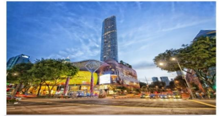
ช้อปปิ้งออร์ชาร์ด