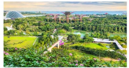
การ์เดิน บาย เดอะเบย์