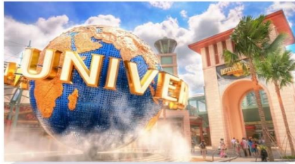
ยูนิเวอร์แซล สตูดิโอ