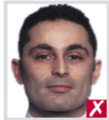
ไกลเกินไป