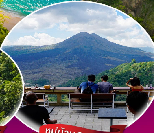
หมู่บ้านคินตามณี