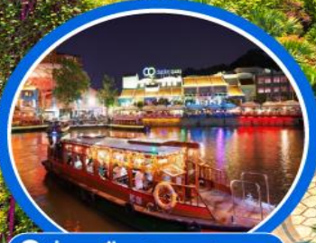
📍 ล่องเรือ Bumboat