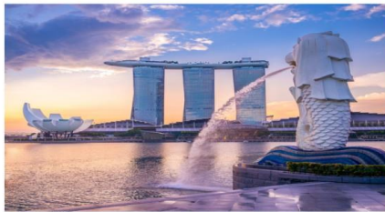
เมอร์ไลออน