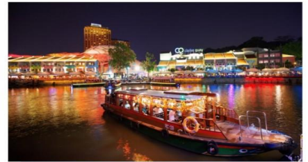
ย่านคลากคีย์ ล่องเรือ Bumboat