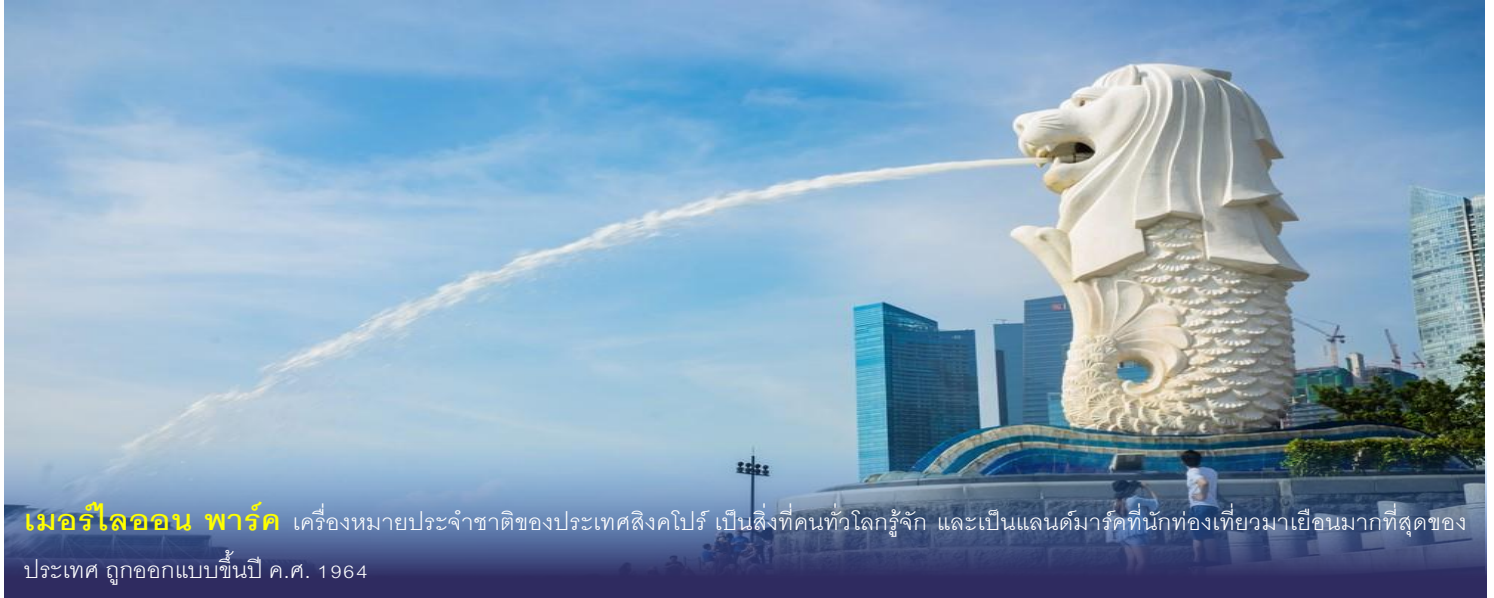
เมอร์ไลออน พาร์ค เครื่องหมายประจำชาติของประเทศสิงคโปร์ เป็นสิ่งที่คนทั่วโลกรู้จัก และเป็นแลนด์มาร์คที่นักท่องเที่ยวมาเยือนมากที่สุดของประเทศ ถูกออกแบบขึ้นปี ค.ศ. 1964

นำท่านเดินทางสู่ ท่าอากาศยานสิงคโปร์ชางงี เพื่อเดินทางกลับสู่กรุงเทพฯ ระหว่างนั้นท่านยังสามารถช้อปปิ้งเลือกซื้อของฝากของที่ระลึกได้ภายในสนามบิน ซ้อปปี้งมอลล์ น้ำตกจีเวล