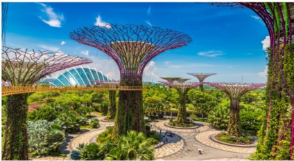
การ์เด็นบายเดอะเบย์