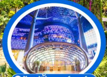
📍 ช้อปปิ้งออร์ชาร์ด