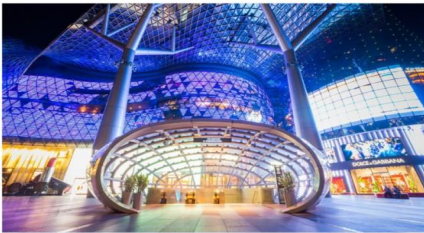
ซ้อปิ้งออร์ชาร์ด