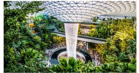
น้ำตกจีเวล