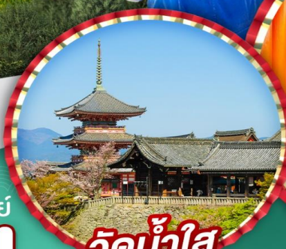
วัดน้ำใส