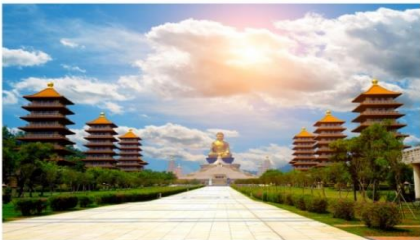
วัดไฟทองซาน