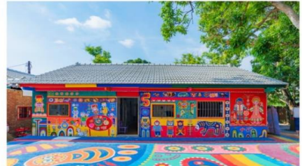
หมู่บ้านสายรุ้ง