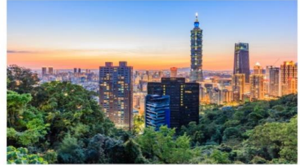
ช้อปปิ้งตึกไทเป101