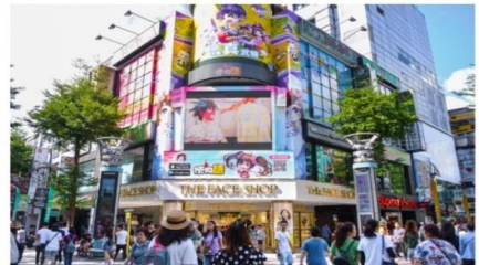
ช้อปปิ้งซีเหมินติง