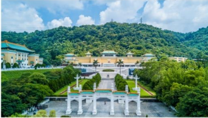
เข้าชมพระราชวังตั้งห้ามักกง