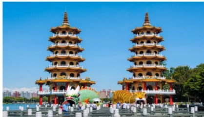
เจดีย์เสือเจดีย์มังกร