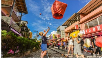
ปล่อยโคมลอยบนรางรถไฟ