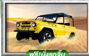
ฟรี!นั่งรถจี๊ป