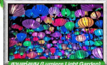
สวนแห่งแสง (Lumiere Light Garden)

เมนู สุดพิเศษ อร่อยไปกับ BBQ / ซิมไวน์แดงดาลัด