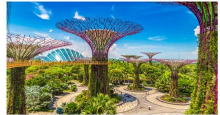
การ์เด็น บาย เดอะเบย์