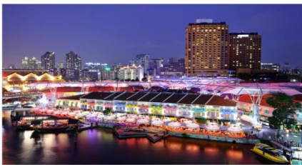
ล่องเรือ BUMBOAT