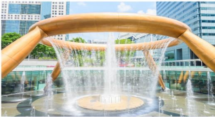
น้ำพุแห่งไซคลาก