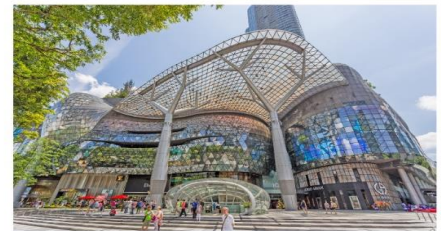
ซ้อปปิงออร์ชาร์ด