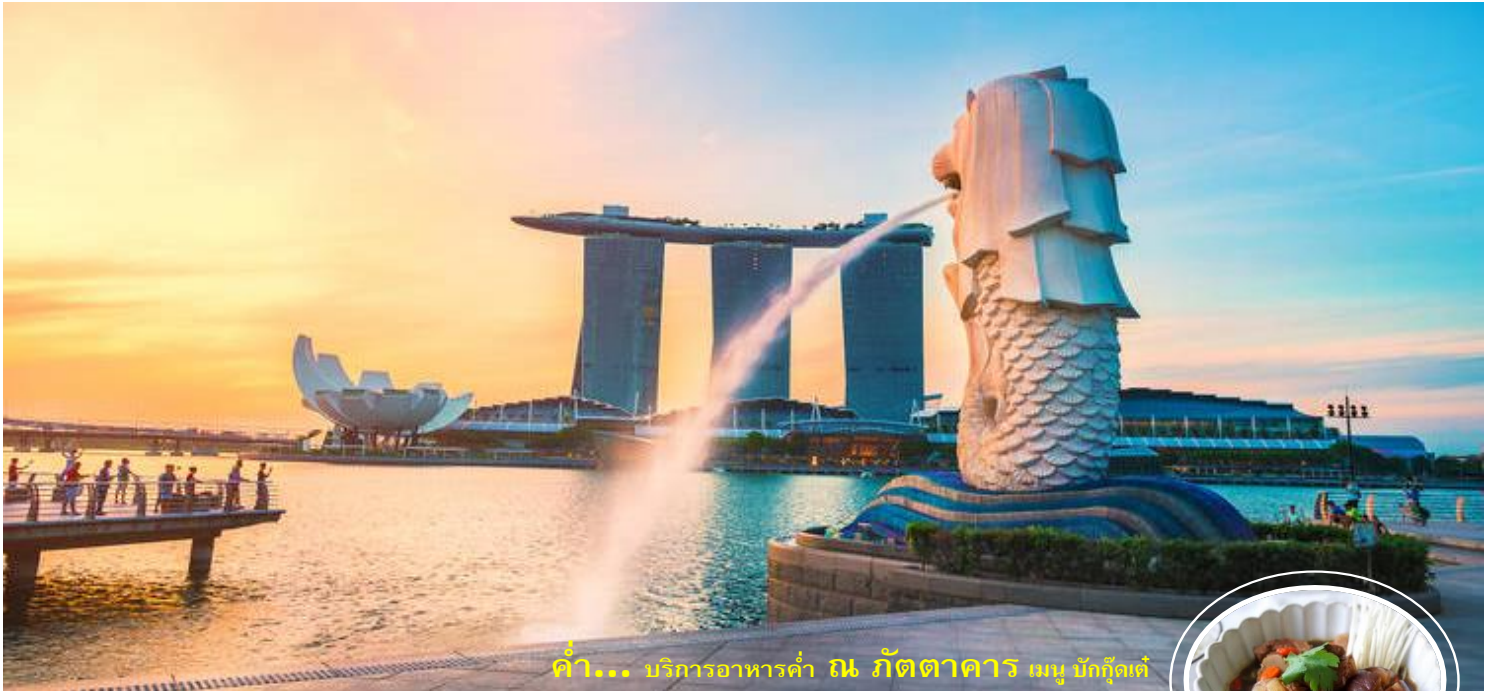
ค่า... บริการอาหารค่ำ ณ ภัตตาคาร เมนู บักก๊อดเต้

เมอร์ไลออน พาร์ค เครื่องหมายประจำชาติของประเทศสิงคโปร์ เป็นสิ่งที่คนทั่วโลกรู้จัก และเป็นแลนด์มาร์คที่นักท่องเที่ยวมาเยือนมากที่สุดของประเทศ ถูกออกแบบขึ้นปี ค.ศ. 1964