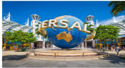
ยูนิเวอร์แซล สตูดิโอ