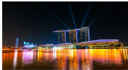
มาริน่าเบย์แซนด์