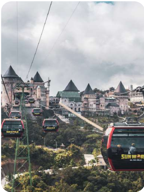
นั่งกระเช้าไฟฟ้า ที่ยาวที่สุดในโลก ขึ้นยอดเขาบานาฮิลล์