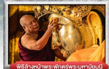
พิธีล้างหน้าพระพุทธรูปพระมหาโมนุญ