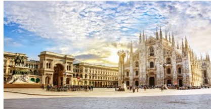
เมืองมิลาน