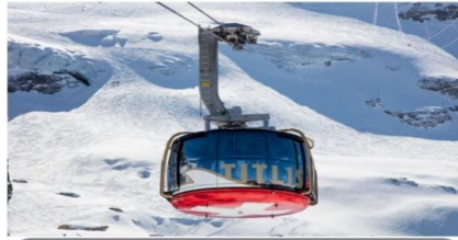
ยอดเขาทิลิส