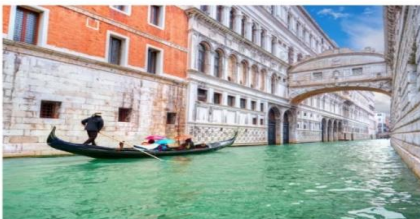
สะพานคอนทราโย