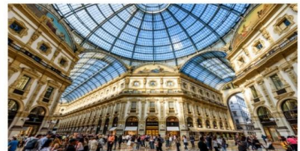
Galleria Vittorio Emanuele II