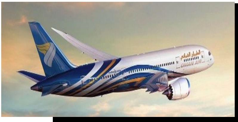
พักที่ Holiday Inn Zurich Airport หรือเทียบเท่า

06.00น. คณะพร้อมกัน ณ ทำอากาศยานสุวรรณภูมิอาคารผู้โดยสารระหว่างประเทศชั้น 4 เคาน์เตอร์สายการบิน โอมานแอร์ โดยมีเจ้าหน้าที่บริษัทฯ คอยให้การต้อนรับ และอำนวยความสะดวกด้านเอกสารต่างๆ 09.15น. บินลัดฟ้าสู่ ทำอากาศยานมัสกัต โดยสายการบิน โอมานแอร์ เที่ยวบิน WY 818 12.35น. เดินทางถึง ทำอากาศยานมัสกัต 14.45น. ออกเดินทางสู่ ทำอากาศยานซูริค สวิตเซอร์แลนด์ โดยเที่ยวบินที่ WY 153 19.05น. เดินทางถึง ทำอากาศยานซูริค สวิตเซอร์แลนด์