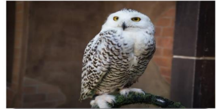
ชมนกฮูกหิมะ (นาเช็ควิกแอร์พอดเตอร์)