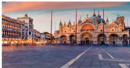
มหาวิหารเซนต์มาร์ก