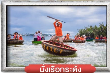
นิงเรือกระดัง