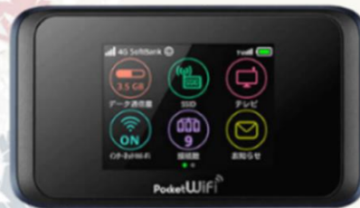
POCKET WIFI สำหรับนำไปใช้ที่ประเทศญี่ปุ่น