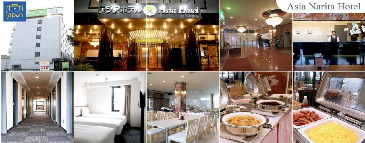
Asia Narita Hotel