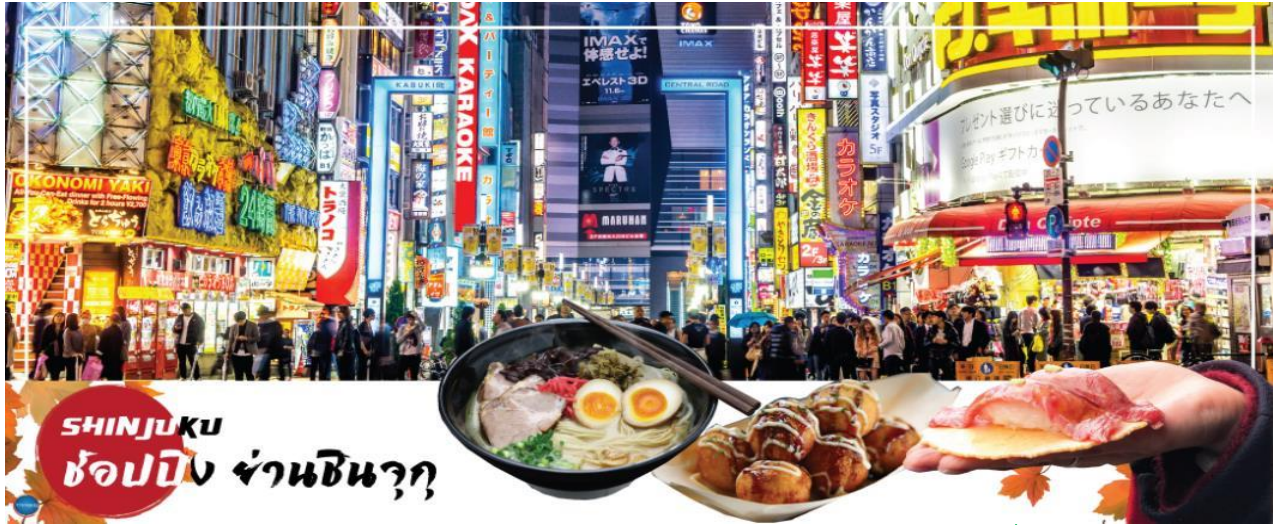
SHINJUKU ช้อปปิ้ง ย่านชินจูกุ

เดินทางกลับสู่ กรุงโตเกียว (Tokyo) (ใช้เวลาเดินทางประมาณ 1.50 ชั่วโมง) เมืองหลวงของประเทศญี่ปุ่น นำท่านช้อปปิ้ง ย่านช้อปปิ้งชินจูกุ (Shinjuku) ให้ท่านอิสระและเพลิดเพลินกับการช้อปปิ้งสินค้ามากมายทั้งเครื่องใช้ไฟฟ้า กล้องถ่ายรูปดิจิตอล นาฬิกา เครื่องเล่นเกม หรือสินค้าที่จะเอาใจคุณผู้หญิงด้วย กระเป๋า รองเท้า เสื้อผ้า แบรินด์เนม เสื้อผ้าแฟชั่นสำหรับวัยรุ่น เครื่องสำอางยี่ห้อดังของญี่ปุ่นไม่ว่าจะเป็น KOSE, KANEBO, SK II, SHISEDO และอื่นๆ อีกมากมาย ห้ามพลาด!!! จุดเช็คอินแห่งใหม่ของชาวโซเชียล นั่นก็คือ แมวยักษ์ 3 มิติ ที่โผล่บนจอแอลอีดีมีขนาดมหึมา ลมมีความโค้งขนาด 154 ตารางเมตร (1,664 ตารางฟุต) เสียงที่ออกจากรูปยนตร์คุณภาพเกรดดี ความละเอียดภาพระดับ 4K ถือเป็นเทคโนโลยีระดับสูง ที่ให้ภาพเสมือนจริงปรากฏเป็นภาพแมวเหมียวเดินเล่นไปมาอยู่เหนือกรุงโตเกียว นอกจากแมวยักษ์แล้ว ท่านยังสามารถรับชมโฆษณาต่างๆ ที่ถูกครีเอทให้เป็นภาพ 3 มิติผ่านจอแอลอีดีนี้ ไม่ว่าจะเป็น แพนด้า, รองเท้าไนกี้, น้องหมา Pomompurin, จานบิน UFO แม้แต่ หุ่นยนต์เครื่องดูดฝุ่น ท่านสามารถรับชมและเก็บภาพได้ตามอัธยาศัย