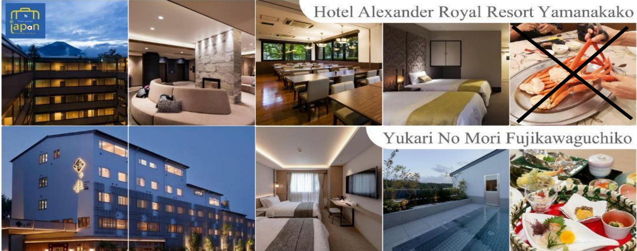
Hotel Alexander Royal Resort Yamanakako

หลังอาหารให้ท่านได้ผ่อนคลายกับการแช่น้ำแร่ธรรมชาติ เชื่อว่าถ้าได้แช่น้ำแร่แล้ว จะทำให้ผิวพรรณ สวยงามและช่วยให้ระบบหมุนเวียนโลหิตดีขึ้น