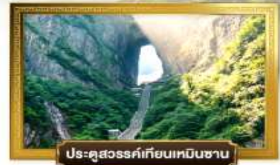
ประตูสวรรค์เทียนเหมินซาน

มือพิเศษ! อาหารพื้นเมืองฉางเจีย | สุกี้เห็ด | ปิ้งย่างสโตร์เกาหลี