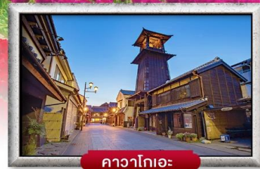
คาวาอิชิโกะ