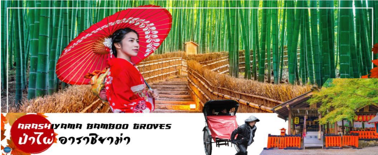
ARASHIYAMA BAMBOO GROVES ป่าไผ่ อาราชิยามา

วันที่สอง ท่าอากาศยานนานาชาติคันไซ โอซาก้า ประเทศญี่ปุ่น – เมืองเกียวโต – อาราชิยามา – สวนป่าไผ่ – สะพานโทเก็ตสึเคียว – การเรียนพิธีชงชาญี่ปุ่น – เมืองโอซาก้า – เล็กซ์โฮลิดี – ช้อปปิ้งชินไซบาชิ