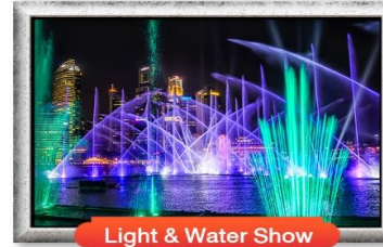
Light & Water Show