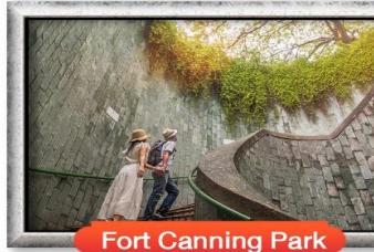
Fort Canning Park