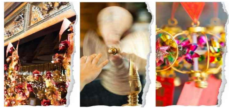
วัดเชกงหวี

นำท่านขอพรเพื่อเป็นสิริมงคล วัดแห่งนี้เป็นที่คนฮ่องกงให้การเคารพนับถือเป็นอย่างมาก เป็นวัดเก่าแก่และมีชื่อเสียงที่สุดวัดหนึ่งของฮ่องกง เป็น 1 ในวัดของฮ่องกงที่ทุกท่านห้ามพลาดเลยทีเดียว