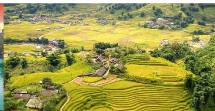
หมู่บ้านต้าฟาน

*กรณีห้องพักรับรองไม่เต็ม ขอสงวนสิทธิ์ในการเปลี่ยนวันเข้าพัก และปรับเปลี่ยนโปรแกรมโดยคำนึงถึงผลประโยชน์ลูกค้าเป็นสำคัญ