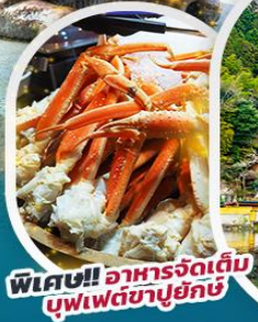
พิเศษ!! อาหารจัดเต็ม บุฟเฟ่ต์ซาปูยักษ์

เยี่ยมชมมรดกโลก ปราสาทคุมาโมโตะ ชมความยิ่งใหญ่ของพระนอนทองสัมฤทธิ์ วัดนันโซอิน ขอพร ศาลเจ้าดาไซฟูเท็มมังกุ เชคอินหมู่บ้านยูฟูอิน ทะเลสาบคินริน ชมวิว Daikanbo ซ้อปปิ้ง Outlets