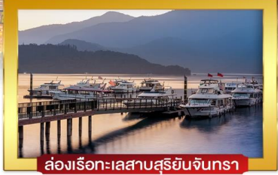
ล่องเรือทะเลสาบสุริยอันจันทร์

เดินทางโดยสายการบินไอลันแอร์ อาหาร : 6 มื้อ โรงแรม : 3 คาว