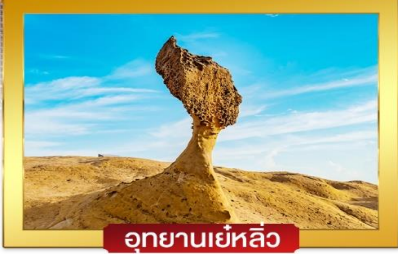
อุทยานเย่หลิว