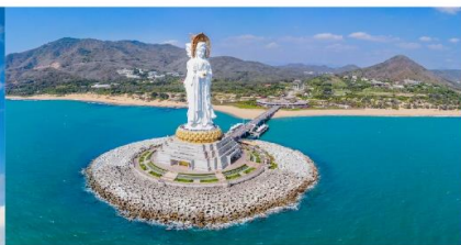
เจ้าแม่กวนอิมหนานชาน