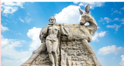
อนุสาวรีย์กวางเหลียวหลิง