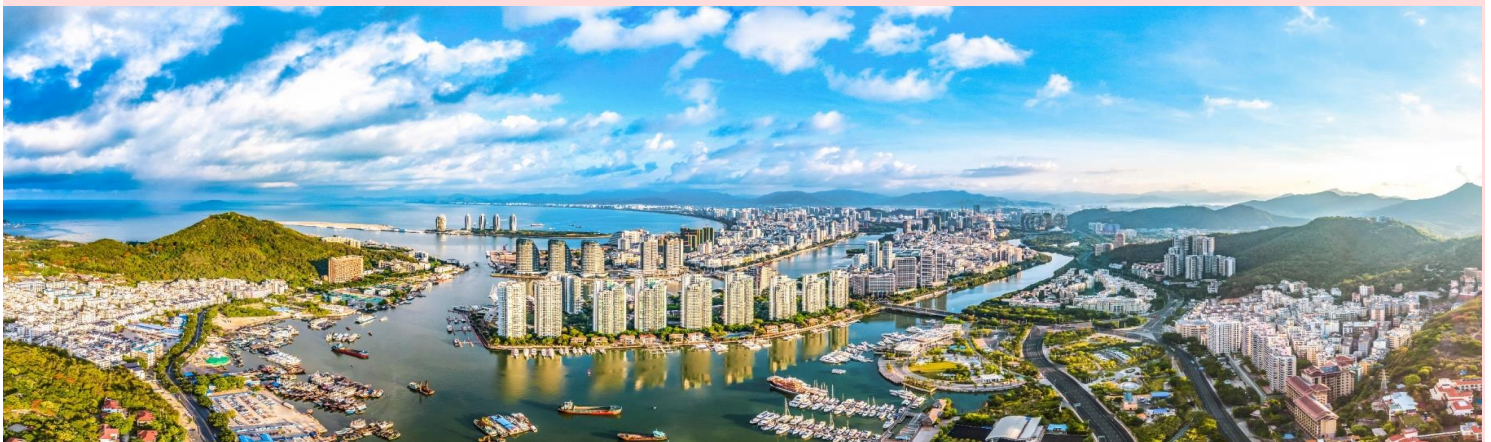
หน้า 6 จาก 18

จากนั้นนำท่านเดินทางสู่ เมืองซานย่า (SANYA) เป็นเมืองที่อยู่ใต้สุดของจีนและเป็นเมืองริมทะเลแห่งเดียวที่ตั้งอยู่ในเขตโซนร้อนของจีน และเป็นเมืองทำสำคัญในการท่องเที่ยวของเกาะไหหลำ (ใช้เวลาเดินทางประมาณ 4 ชั่วโมง)