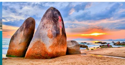
วนอุทยานสุดขอบฟ้า

*ทางบริษัทฯ ขอสงวนสิทธิ์ในการสลับโปรแกรมทัวร์ตามความเหมาะสมขึ้นอยู่กับสถานการณ์หน้างาน โดยคำนึงถึงผลประโยชน์ของลูกค้าเป็นสำคัญ