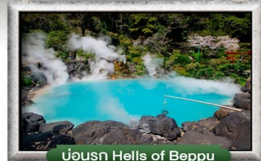
บ่อนรก Hells of Beppu