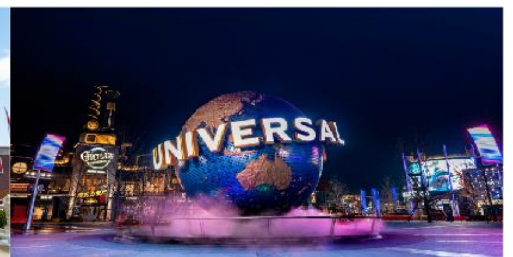
ยูนิเวอร์เซล ปักกิ่ง รีสอร์ท

*ทางบริษัทฯ ขอสงวนสิทธิ์ในการสลับโปรแกรมทัวร์ตามความเหมาะสมขึ้นอยู่กับสถานการณ์หน้างาน โดยคำนึงถึงผลประโยชน์ของลูกค้าเป็นสำคัญ