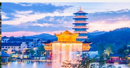
ล่องเรือชมแสงสียามค่ำคืนฉู่หนี่โจว