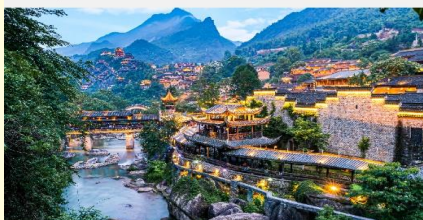
หุบเขาเทวดาฉางเซียงหนู่