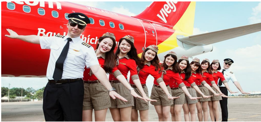
วันที่ห้า (5) สนามบินสุวรรณภูมิ กรุงเทพฯ