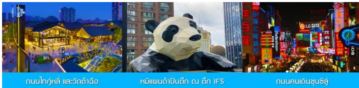
ถนนไท่กู่หลี่ และวัดต้าฉือ