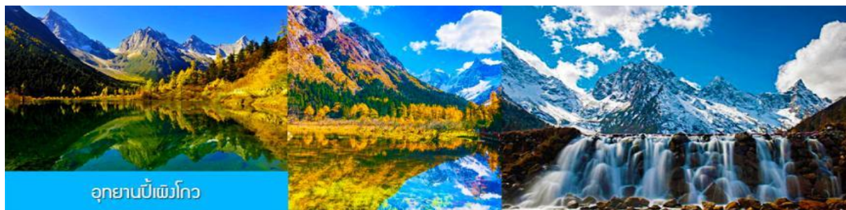
อุทยานบีเพ็งโกว