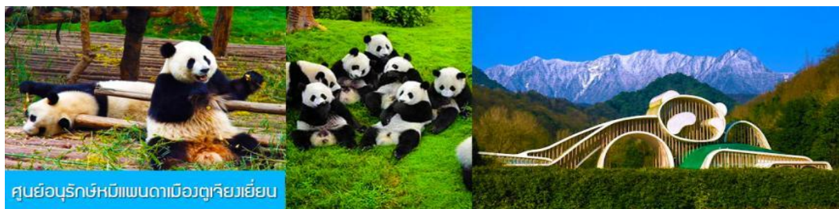
ศูนย์อนุรักษ์หมีแพนดาเมืองตู่เจียงเยียน