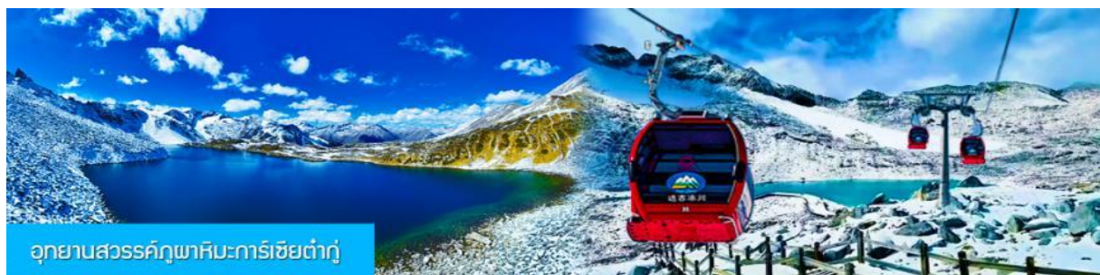
อุทยานสวรรค์ภูผาหิมะการ์เซียต้ากู่