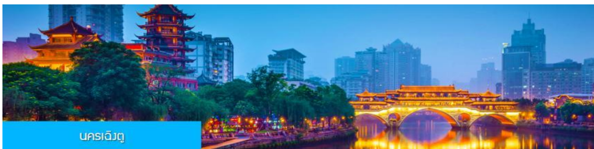
นครเจียงตู