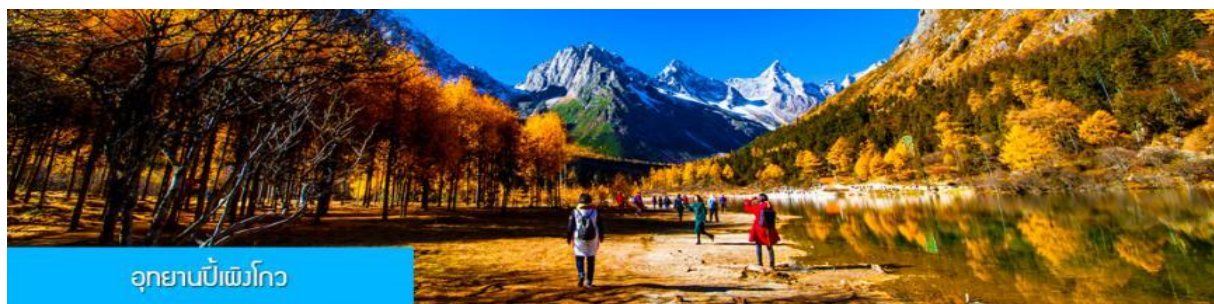
อุทยานบีเพ็งโกว