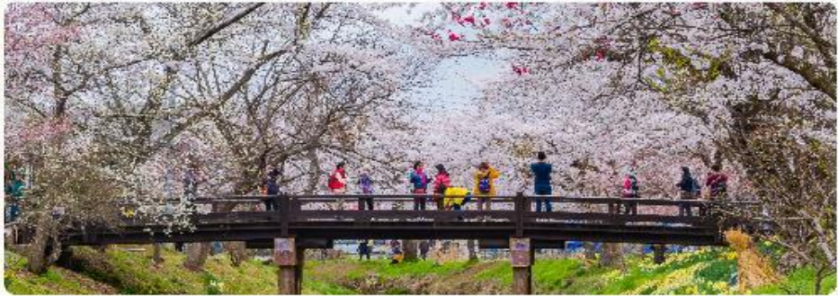
หมู่บ้านน้ำใสโอชิโนะ อักโก

โอชิโนะ อักโก หรือ ที่รู้จักกันในชื่อ หมู่บ้านน้ำใส ความงามแห่งธรรมชาติและวัฒนธรรมที่ ซ่อนอยู่ใต้เงากุเขาไฟฟูจิโอชิโนะ อักโก ตั้งอยู่ในหมู่บ้านโอชิโนะ จังหวัดยามานาชิ ประเทศญี่ปุ่น เป็นแหล่งน้ำธรรมชาติที่มีชื่อเสียง ประกอบด้วยบ่อน้ำใสสะอาดทั้งแปดแห่ง ซึ่งน้ำในบ่อน้ำนี้เกิด จากการละลายของหิมะและน้ำแข็งจากกุเขาไฟฟูจิ น้ำที่ไหลลงมานั้นได้ถูกกรองผ่านชั้นหินภูเขาไฟ