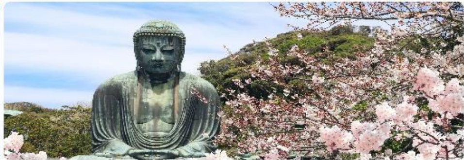
พระใหญ่ไดบุทสึ วัดโคโตคุอิน

จุดเด่นแห่งเมืองนี้คือ พระพุทธรูปองค์ใหญ่ไดบุทสึ (Daibutsu) หนึ่งในสัญลักษณ์ที่โดดเด่นที่สุดของ Kamakura พระพุทธรูปbronzeขนาดมหึมาที่วัดโคโตคุอิน (Kotoku-in) ที่มีความสูง 13.35 เมตร หนึ่งในพระพุทธรูปที่ใหญ่ที่สุดในญี่ปุ่น ไฮไลท์ของที่นี่คือการได้ชมความงามที่ตัดกันระหว่างพระพุทธรูปไดบุทสึขนาดใหญ่และต้นซากุระ ซึ่งปลูกอยู่ทั้งด้านหน้าและด้านหลังของพระพุทธรูป ทำให้เหมาะอย่างยิ่งกับการเดินเล่นและชมซากุระในบริเวณวัด เป็นอีกหนึ่งสถานที่ที่ต้องมาเยือนสักครั้ง หนึ่งในจุดไฮไลท์ของเมืองคามาคุระคือ ไม่ไกลกันพ่ายื่น เกาะเอโนชิมะ (Enoshima) เป็นเกาะที่ตั้งอยู่ในจังหวัดคานากาวะ ประเทศญี่ปุ่น ซึ่งเป็นจุดหมายท่องเที่ยวยอดนิยมที่มีทิวทัศน์สวยงามและสถานที่ที่น่าสนใจมากมาย ทั้งชายหาดสวย และวิวทะเลที่งดงาม ในวันที่ท้องฟ้าโปร่งใสเรายังสามารถมองเห็นวิวของภูเขาไฟฟูจิได้อีกด้วย ด้านบนยังมี ศาลเจ้าเอโนชิมะ ที่มีความสำคัญในด้านความโชคดี โดยเฉพาะในเรื่องความรัก นอกจากนี้ยังมี หอคอยประภาคารเอโนชิมะ ที่ให้ทัศนียภาพ 360 องศา ของเมืองคามาคุระได้อีกด้วย