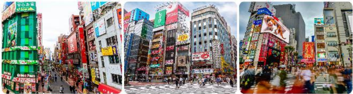
ช้อปปิ้งใจกลางกรุงโตเกียว - ชินจูกุ

มื้อกลางวัน บริการท่านด้วย ชุดอาหารญี่ปุ่นเบนโตะ