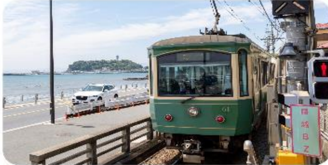
เมืองคามาคุระ