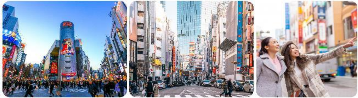
ช้อปปิ้งใจกลางกรุงโตเกียว