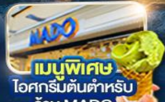
เมนูพิเศษ ไอศกรีมต้นตำหรับร้าน MADO