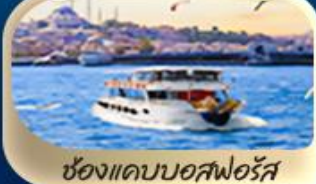
ช่องแคบบอสฟอรัส

19-27 มี.ค.68 / 4-12 เม.ย.68 / 6-14 เม.ย.68 13-21 เม.ย.68 / 19-27 เม.ย.68 / 3-11 พ.ค.68