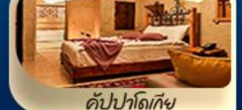
คัปปาโดเกีย

ไฮไลท์ สัมผัสประสบการณ์ ดินแดนสองทวีป มรดกโลกอันทรงคุณค่า ม้าไม้เมืองทรอย สุเหร่าสีน้ำเงิน ปราสาทปุยฝ้าย ทะเลสาบเกลือ หอคอยกาลาตา เที่ยวชม เมืองโบราณเฮียราโพลิส นครใต้ดินชาตค พระราชวังทอปกาปี ฮาเกียโซเฟีย สุสานฮาดี สุสานอตาติร์ก