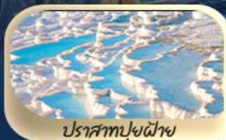
ปราสาทปุยฝ้าย