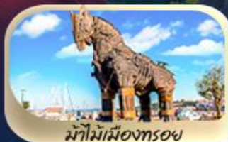
ม้าไม้เมืองทรอย