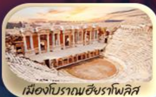
เมืองโบราณเฮียราโพลิส