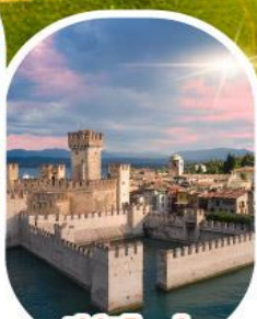
ซีร์มิโอนี

เดินทาง 28 เม.ย. - 04 พ.ค. 68 30 พ.ค. - 05 มิ.ย. 68 11-17 มิ.ย. 68