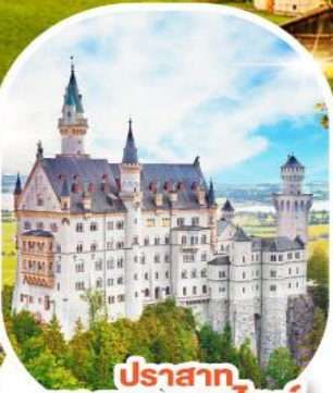
ปราสาท บอยชวานชไตน์