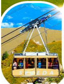
กระเช้าซีเคด้า