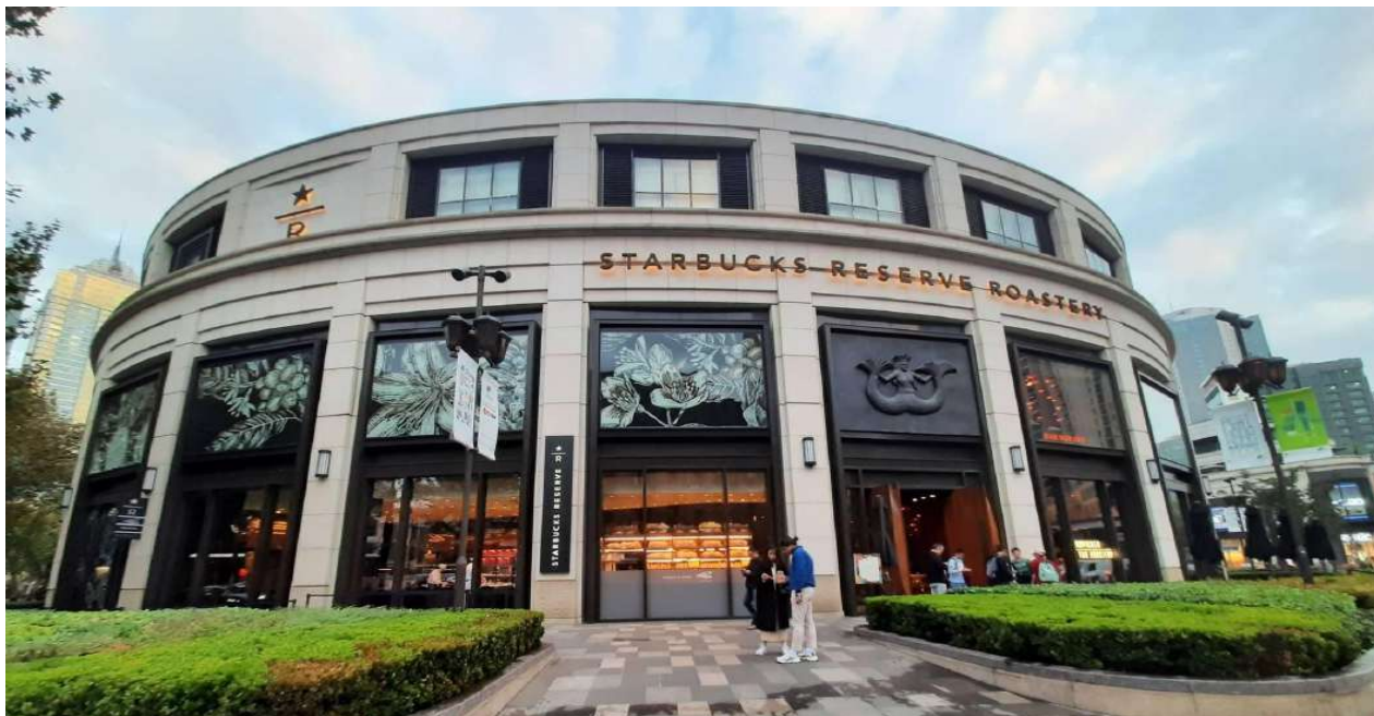
จากนั้นนำท่านสู่ ถนนนานกิง ถือเป็นถนนสายเก่าแก่ของเมืองเชียงใหม่ซึ่งมีความยาวถึง 5.5 กม. อิสระให้ท่านได้เลือกซื้อหาของฝากตามอัธยาศัย

เช้า รับประทานอาหารเช้า ณ ห้องอาหารโรงแรม จากนั้นนำท่านชม ดิסקอวอร์ด สาขาใหญ่ที่สุดในโลก ณ มหานครเชียงใหม่ อยู่บนอาคาร 2 ชั้น พื้นที่กว่า 2,700 ตารางเมตร พร้อมพนักงานกว่า 400 คน ใหญ่กว่าสาขาปกติถึง 300 เท่าด้านบนของร้านตกแต่งด้วยแผ่นไม้รูปหกเหลี่ยม ด้วยงานแฮนด์เมดจำนวน 10,000 แผ่น มีถึงคั่วกาแฟทองเหลืองขนาด 40 ตัน สูงเท่าตึก 2 ชั้น ประดับประดับด้วยแผ่นตราประทับแบบจีนโบราณมากกว่า 1,000 แผ่นมีบาร์จิบกาแฟที่ยาวที่สุดในโลกที่ยาวถึง 88 ฟุต มีเครื่องดื่มมากกว่า 100 ชนิด รวมไปถึงเครื่องดื่มที่มีเฉพาะสาขานี้แห่งเดียว มีเบเกอรี่ที่รสชาติใหม่ๆมากกว่า 80 ชนิด