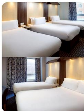
ห้องพัก สำหรับ 3 ท่าน TRIPLE ROOM (TRP)

กรณีห้อง Twin Bed ของทางโรงแรมไม่มีหรือเต็ม ทางบริษัทขอปรับเป็นห้อง Double Bed แทน หรือ หากต้องการห้องพักแบบ Double Bed ของทางโรงแรมไม่มีหรือเต็ม ทางบริษัทขอปรับเป็นห้อง Twin Bed แทน และหากต้องการพักแบบ Triple Room ของทางเราไม่มีหรือเต็ม ทางบริษัทขอปรับเป็นห้อง 1 เตียงใหญ่ (Queen Size) + 1 เตียงเล็กแทน โดยมีต้องแจ้งให้ทราบล่วงหน้า กรณีที่ทำมาเป็นครอบครัวใหญ่และมีการริควงของห้องพักคนละประเภท หรือ ประเภทเดียวกัน ห้องพักวันที่เข้าพักอาจจะไม่ได้อยู่ใกล้กัน หรือ อาจจะไม่ได้อยู่ในชั้นเดียวกัน เนื่องด้วยแต่ละโรงแรมมีการจัดห้องพักที่แตกต่างกันไป