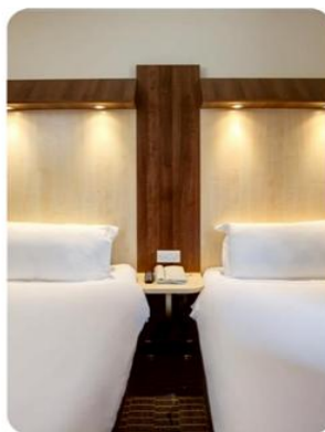
ห้องพัก สำหรับ 2 ท่าน TWIN ROOM (TWN)