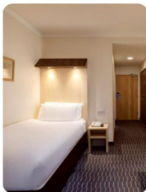
ห้องพัก สำหรับ 1 ท่าน SINGLE ROOM (SGL)