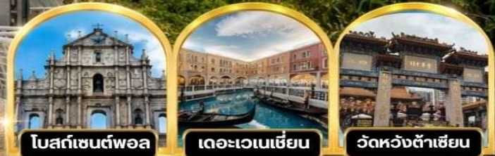
โบสถ์เซนต์ฟอล