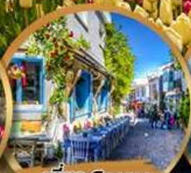
เที่ยว Cesme Alacati