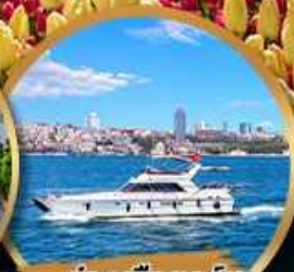
ล่องเรือออร์ซ ชมช่องแคบบอสฟอรัส