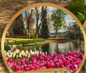
เทศกาลทิวลิป Emirgan Park

28 มี.ค. - 04 เม.ย. / 09 - 16 เม.ย. / 12 - 19 เม.ย.