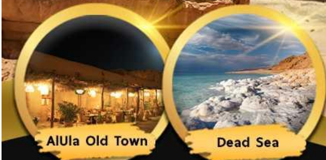
AlUla Old Town