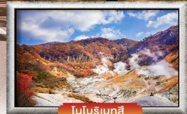
โอบุริเทสึ