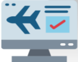
การจองทัวร์: