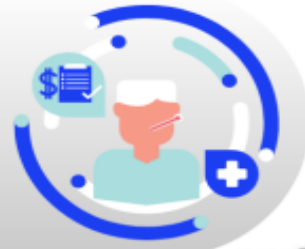
กรณีเจ็บป่วย:

กรณีเจ็บป่วยจนไม่สามารถเดินทางได้ ต้องมีใบรับรองแพทย์จากโรงพยาบาล บริษัทฯ จะทำการเลื่อนการเดินทางของท่านไปยังคณะต่อไป ทั้งนี้ ท่านจะต้องเสียค่าใช้จ่ายที่ไม่สามารถยกเลิก หรือเลื่อนการเดินทางได้ตามความเป็นจริง