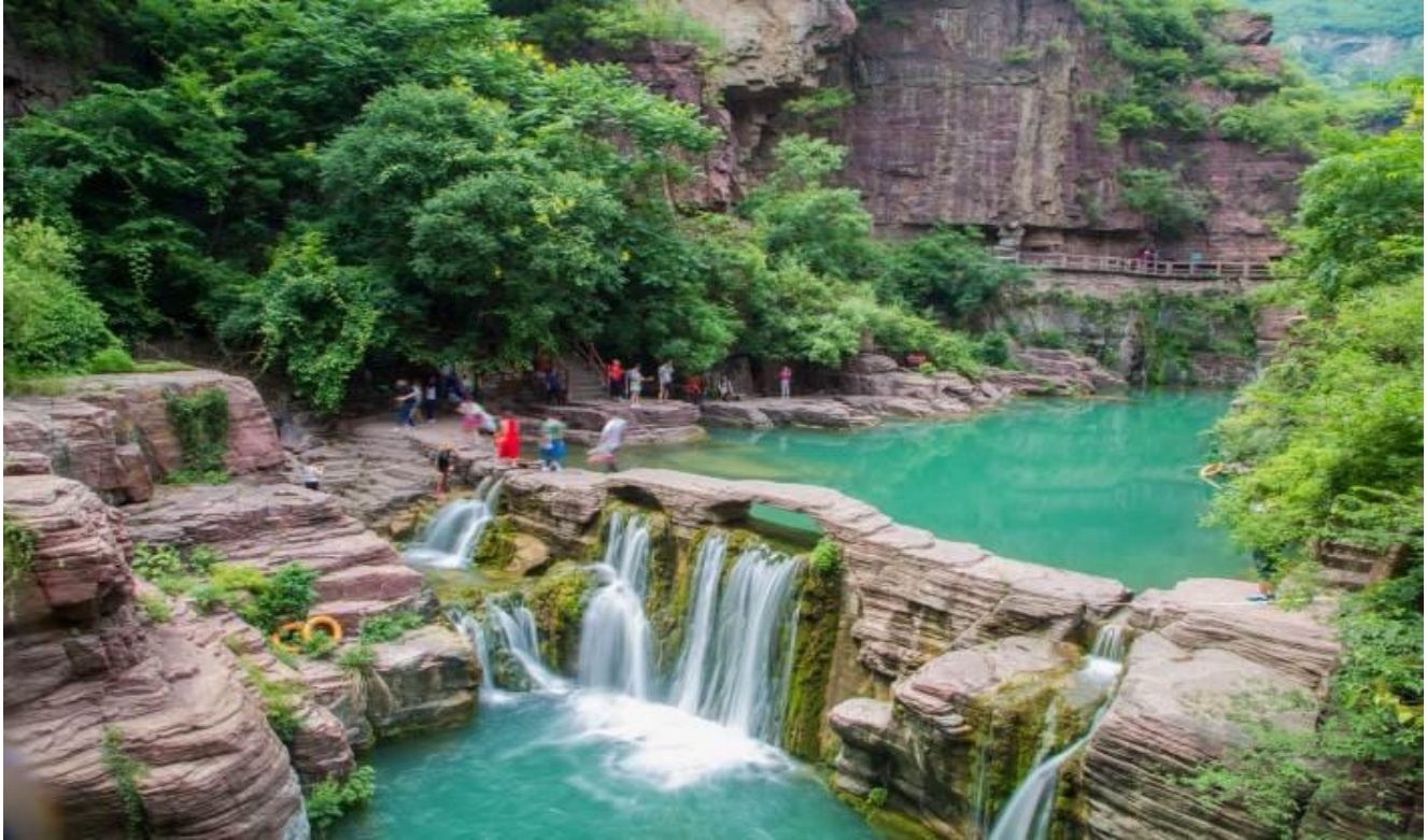
นาม จิวโจ้วไกวน้อย อีกด้วย

บริษัท พอยท์ ออฟ วิว ทราเวล จำกัด. 129 ถนนจักรวรรดิ แขวงจักรวรรดิ เขตสัมพันธวงศ์ กรุงเทพฯ 10100 point of view travel @povtravel info@povtravel.co.th 02-222-0822 ใบอนุญาตเลขที่ 11/09926