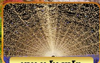
เกาะน้ำพุ: