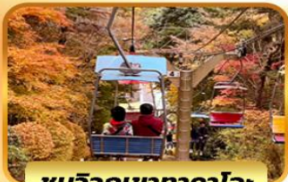
ชมวิวกุเขากาโอะ: