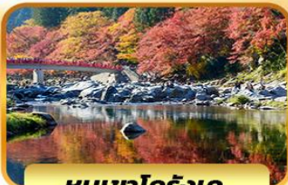
หุบเขาโคริงเค